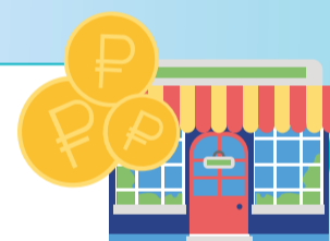
Объём платных бытовых услуг