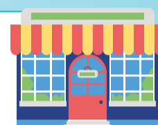
Число объектов бытового обслуживания на начало года