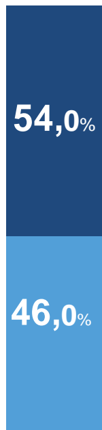
Динамика оборота розничной торговли пищевыми продуктами, включая напитки, и табачными изделиями и непродовольственными товарами

(в сопоставимых ценах; в % к соответствующему периоду предыдущего года)